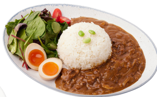
Horin Curry 風凛カレーライス