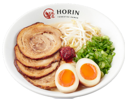
Any Tonkotsu Ramen Collection とんこつラーメン

From any Tonkotsu Ramen or Vegetarian Ramen or Curry Rice