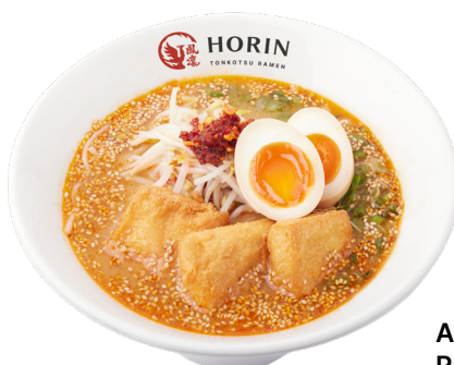
Any Vegetarian Ramen Collection ベジタリアンラーメン